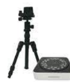
オプション： 三脚+ターンテーブル ¥145,000-