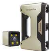
ベーシック+ カラー取得モジュール ¥909,000-