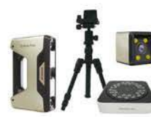
ベーシック+三脚+ターンテーブル+ カラー取得モジュール ¥1,054,000-