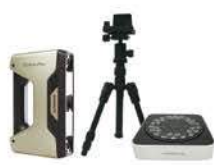
ベーシック+三脚+ ターンテーブル ¥909,000-